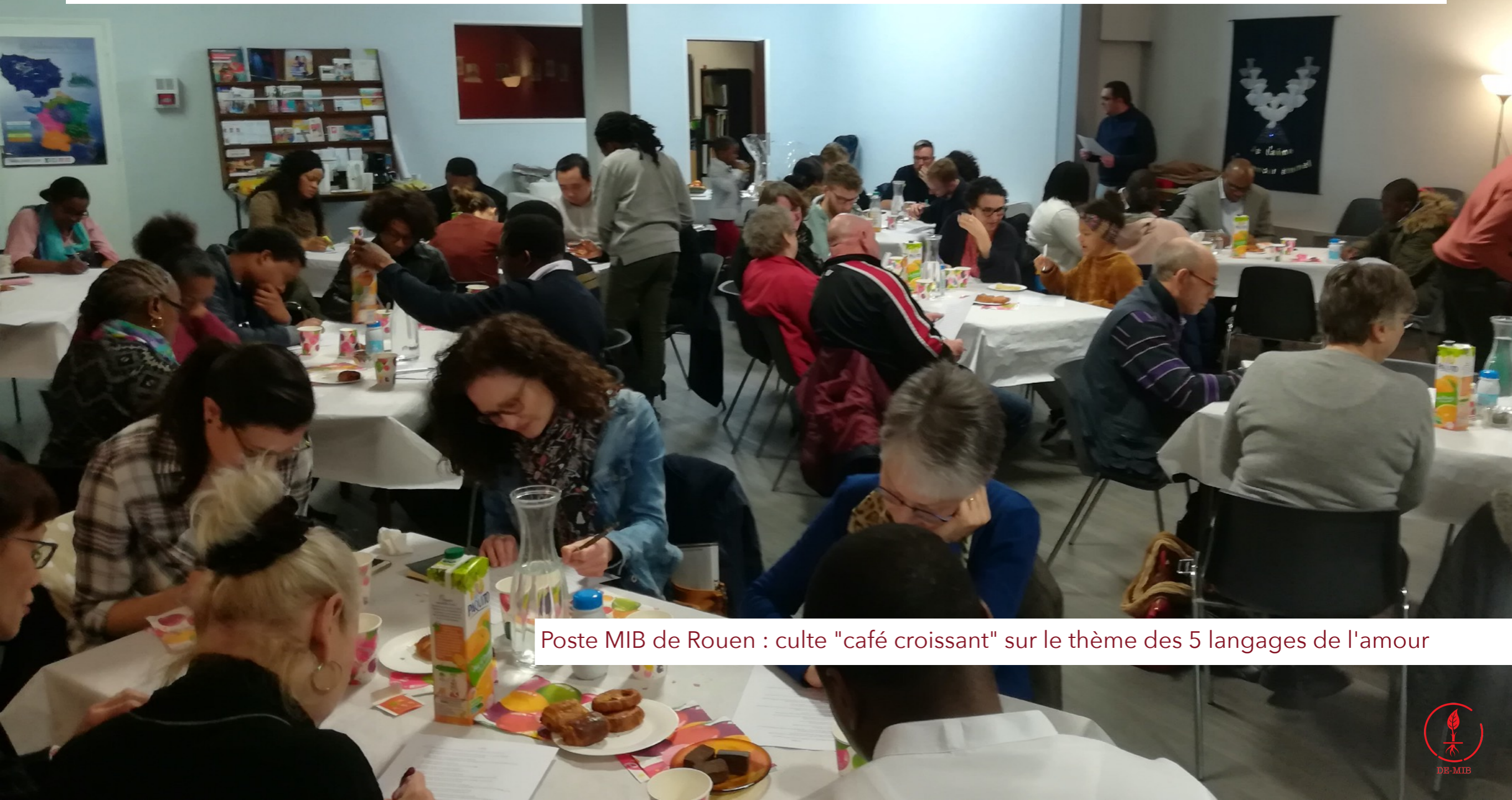
Poste MIB de Rouen : culte "café croissant" sur le thème des 5 langages de l'amour

UN POWERPOINT PRÉSENTANT LA M.I.B. EST À TÉLÉCHARGER ICI + sa version directe pour diffusion automatique